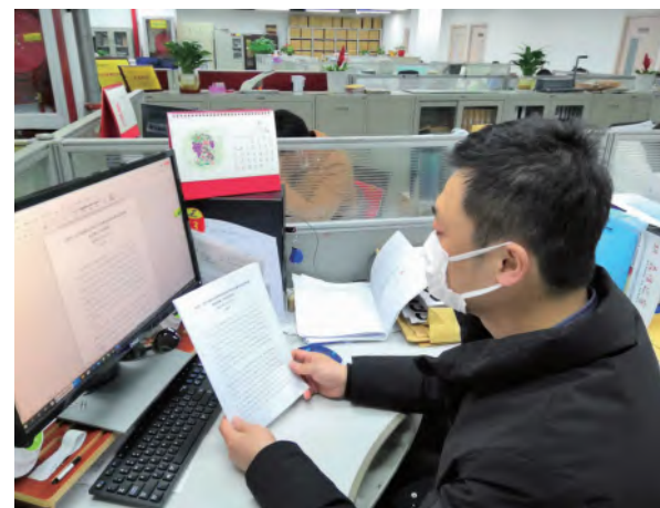
文 / 行政办 顾茵

学习之余，全体党员以“不忘初心，凝心抗疫”为主题，谈认识、谈感受、谈工作。大家一致表示，尽管当前项目进度受疫情影响略有滞后，但是作为公司生产经营中的骨干力量，党员同志更应在这场战役中勇当先锋、敢打头阵、主动担当、积极作为，立足平凡岗位，争创一流业绩，用实际行动为党旗添彩，为助力公司发展做出应有贡献！