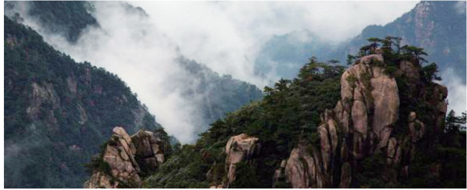
图并文 / 惠南项目部 孙亮亮

这一路走走停停，人来人往，有虔诚的僧侣，有功德无量的游客，有为寺庙修缮劳作的人们，