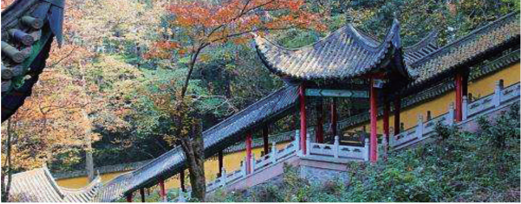
文 / 安装分公司 高海兵

早餐后，搭乘巴士至索道口，一路上风景奇异，奇峰异山叠起，怪石嶙峋。导游说九华山是地藏王菩萨的道场。整个风景区有九十九座山峰，九十九座寺