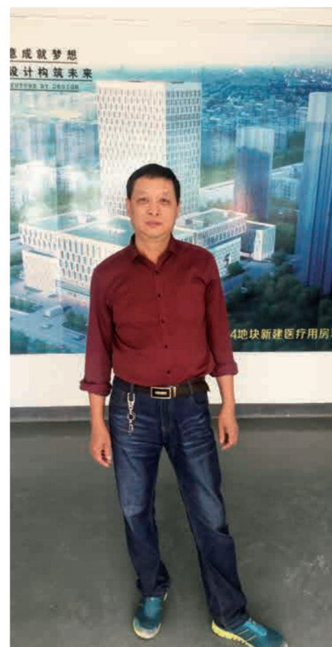
图开文/彩虹湾医院项目部 石龙

对进入一个全新工作环境的新员工来说，我虽然在过去的工作中积累了一定的工作经验，但刚进入公司，难免还是有点压力。有问题还需要及时请教同事。能成为公司的一员，我感到无比的幸运和自豪，相信这种自豪将使我更有激情的投入到工作中。